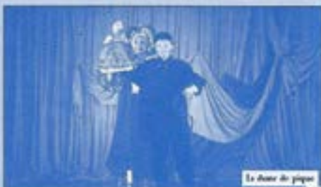
La dame de pique