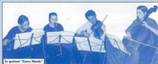
Le quatuor "Sorelle Mendel"

Réunis dans une formation originale ces quatre musiciens vous feront vibrer au son de la flûte, clarinette, alto et violoncelle. Leur interprétation vous fera partager la grâce et l'élégance de la musique de Mozart avec son quatuor n° K387.