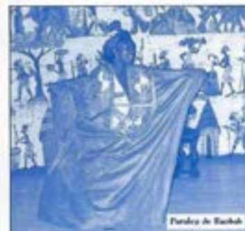
Pandora de Baobab

D écouverte d'instruments traditionnels d'Afrique : origine et évolution, démonstration sur chaque instrument, initiation au rythme, jeux sur le bala et les tambours, jeux dansés et chantés.