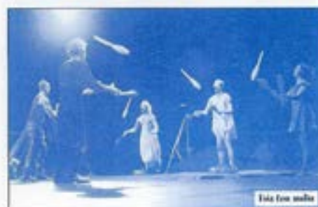
Fais ton malin

Vendredi 7 avril - 10 h et 14 h 30 - SALLE DES FÊTES