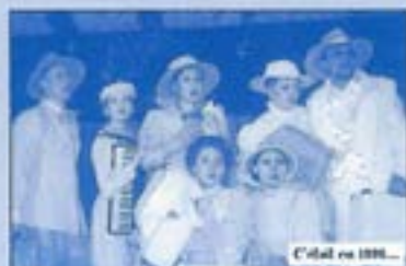
C'etal en 1998...

On entend la musique, les rires, la fête mais les piques-niques en temps de guerre... !!