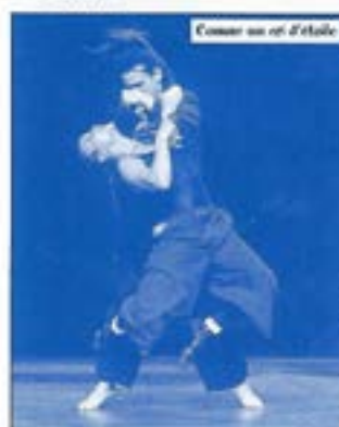
Comme un cri d'étoile

par Traction Avant Cie - Vénissieux (69)